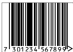
Storlek 0.85 Undvik att höjrdreusera denna storlek