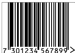
Storlek 0.90 Undvik att höjrdreusera denna storlek