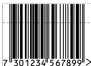
Storlek 1.10 *