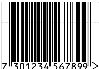
Storlek 1.20 *