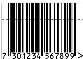
Storlek 1.00 * Denna symbolstorlek kan höjrdreuseras med max 30% (reduering av strecklängden). Undvik om det ej är nödvändigt.